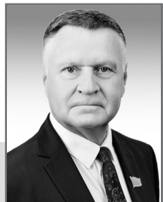
Владимир ВОЛКОВ , председатель Комитета по конституционному законодательству, судебной системе и правоохранительным органам Сената Парламента РК

Глава государства публично подписал ряд законов, принятых по итогам состоявшегося в июне 2022 года республиканского референдума о внесении изменений и дополнений в Конституцию. Среди них Закон РК «О внесении изменений и дополнений в некоторые конституционные законы Республики Казахстан по вопросам реализации Послания Главы государства от 16 марта 2022 года», который предусматривает внесение поправок в восемь конституционных законов.