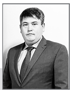
Сәкен СӘДУАҚАС, председатель Щербактинского районного суда Павлодарской области

Гражданские дела о признании гражданина безвестно отсутствующим или объявлении умершим рассматриваются в соответствии с гл. 34 Гражданского процессуального кодекса Республики Казахстан.