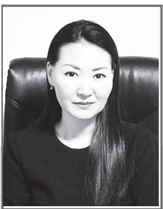
Динара НУРЖАНОВА, председатель Иртышского районного суда Павлодарской области

Наибольший интерес и затруднения при рассмотрении и разрешении дел о компенсации морального вреда вызывает проблема судебного доказывания.