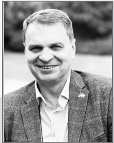
Роман ПОДОПРИГОРА , профессор, директор НИИ публичного права Каспийского университета, доктор юридических наук

Обратил внимание на то, что часто футболисты, вне зависимости от команды и вероисповедания, молились на футбольном поле. Молились и молились, что такого? Но я проецирую это на родное законодательство и правоприменительную практику.