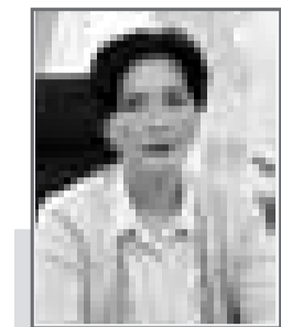
Инна ДЕМИДОВА, судья Специализированного межрайонного административного суда Карагандинской области

В административном судопроизводстве предметом спора, вытекающего из трудовых отношений, может являться разногласие между частным лицом (работником, работодателем) и административным органом, возникшее в результате реализации последним своих властных полномочий.