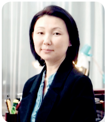
Рауна САГЫНДЫКОВА, судья Специализированного межрайонного административного суда Карагандинской области

Одной из категорий дел, по которой граждане часто обращаются в суд с исками о защите нарушенных прав, являются споры по делам в сфере архитектурной, строительной и градостроительной деятельности.