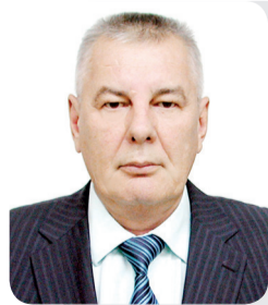
Асхат НУРКИЕВ, судья Специализированного следственного суда г. Павлодар

Указом Президента РК от 10 января 2018 года в областных центрах и городах республиканского значения образованы специализированные и специализированные межрайонные следственные суды.