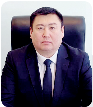
Ермеқ КУСАИНОВ, председатель Аксуского городского суда Павлодарской области

Республика Казахстан придерживается международных стандартов защиты прав человека и принимает активные меры по снижению уровня преступности в семейно-бытовых отношениях.