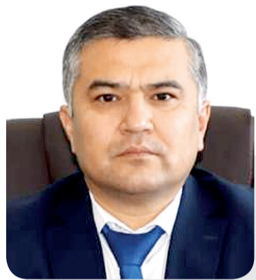
Асланбек ДЮСИНГАЛИЕВ, председатель Специализированного межрайонного суда по уголовным делам ЗКО

Позиция законодателя обусловлена обеспечением на правовом уровне полноты, объективности и достоверности информации, используемой субъектами доказывания — дознавателем, следователем, прокурором и судом — при установлении обстоятельств, имеющих значение для правильного разрешения уголовных дел.