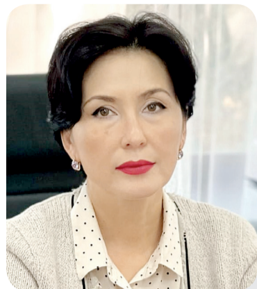
Инна ДЕМИДОВА, судья Специализированного межрайонного административного суда Карагандинской области

Одной из категорий споров, рассматриваемых административными судами, являются дела об оспаривании административных актов (действий/ бездействий), выносимых в сфере архитектурной, строительной и градостроительной деятельности.