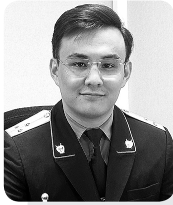
Фылымқожа АНУАРОВ, прокурор управления прокуратуры г. Астаны

НА СЕГОДНЯШНИЙ ДЕНЬ РАСПРОСТРАНЕНИЕ НАРКОТИЧЕСКИХ СРЕДСТВ ЯВЛЯЕТСЯ СЕРЬЕЗНОЙ УГРОЗОЙ ДЛЯ ОБЩЕСТВА, НЕСЕТ РАЗРУШИТЕЛЬНЫЕ ПОСЛЕДСТВИЯ ДЛЯ ЗДОРОВЬЯ, БЕЗОПАСНОСТИ И СТАБИЛЬНОСТИ. НАРКОТИКИ И ПСИХОТРОПНЫЕ ВЕЩЕСТВА СПОСОБНЫ РАЗРУШИТЬ ЖИЗНИ ЛЮДЕЙ И ИХ СЕМЬИ, ПОДОРВАТЬ СОЦИАЛЬНУЮ СТАБИЛЬНОСТЬ.