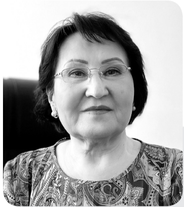
Ляззат МУХАМЕДЖАНОВА, судья Специализированного межрайонного суда по уголовным делам Костанайской области

На сегодняшний день распространение и употребление наркотических средств, психотропных веществ, их аналогов, прекурсоров становится общенациональной проблемой, которая по своим долгосрочным последствиям относится к категориям прямых угроз национальной безопасности.