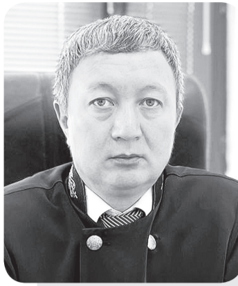
Ардак НАЗАРОВ, судья Специализированного межрайонного административного суда Карагандинской области

В административном судопроизводстве предметом спора, вытекающего из трудовых отношений, может являться разногласие между частным лицом (работником, работодателем) и административным органом, возникшее в результате реализации последним своих властных полномочий.