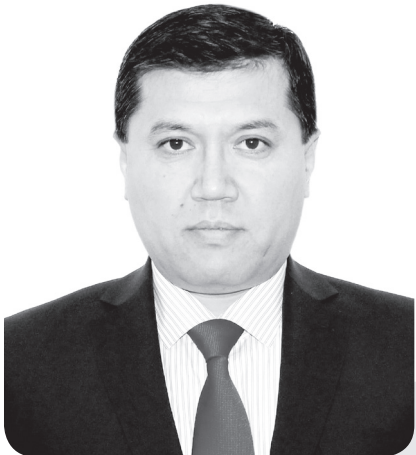
Алтай ШАРХАНОВ, судья Специализированного межрайонного административного суда Туркестанской области

Судебная практика по Туркестанской области представляет собой споры, связанные с земельными вопросами (более четверти или 18,7 процента), в сфере государственных закупок (19,7 процента), налоговых споров 43 (7,3 процента) и прочие.