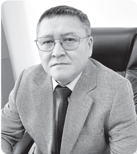
Адлет БАКТИЯРОВ, председатель Специализированного межрайонного административного суда Павлодарской области

Как и Гражданский процессуальный кодекс, Административный процедурно-процессуальный кодекс предусматривает возможность устного и письменного судебного разбирательства споров.