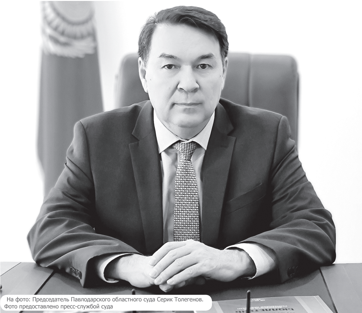
На фото: Председатель Павлодарского областного суда Серик Толегенов.

в Китае решения остаются за человеком. В Казахстане возможна постепенная интеграция ИИ, но с обязательным учетом правовых и этических ограничений.