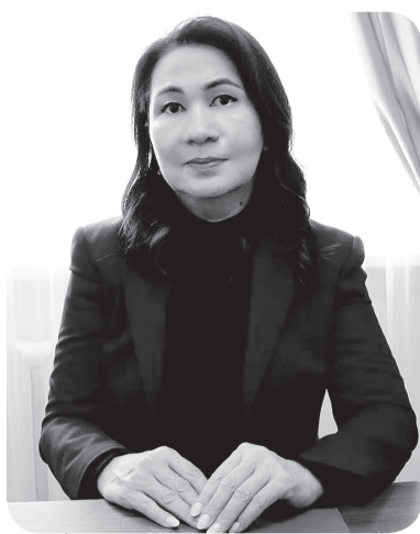
Анар МАМАНОВА, судья Акмолинского областного суда